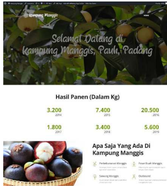
Gambar 1. Home Page - Bagian 1